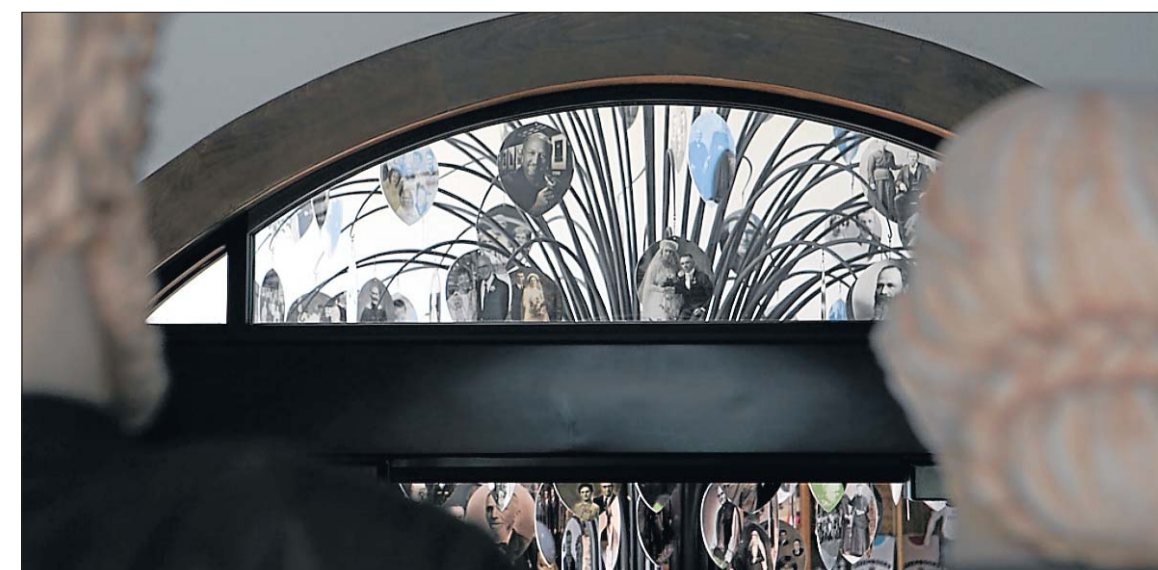
Die Auswandererfamilie hat den Family Tree mit Fotos von Pionieren und deren Nachfahren stets im Blick.