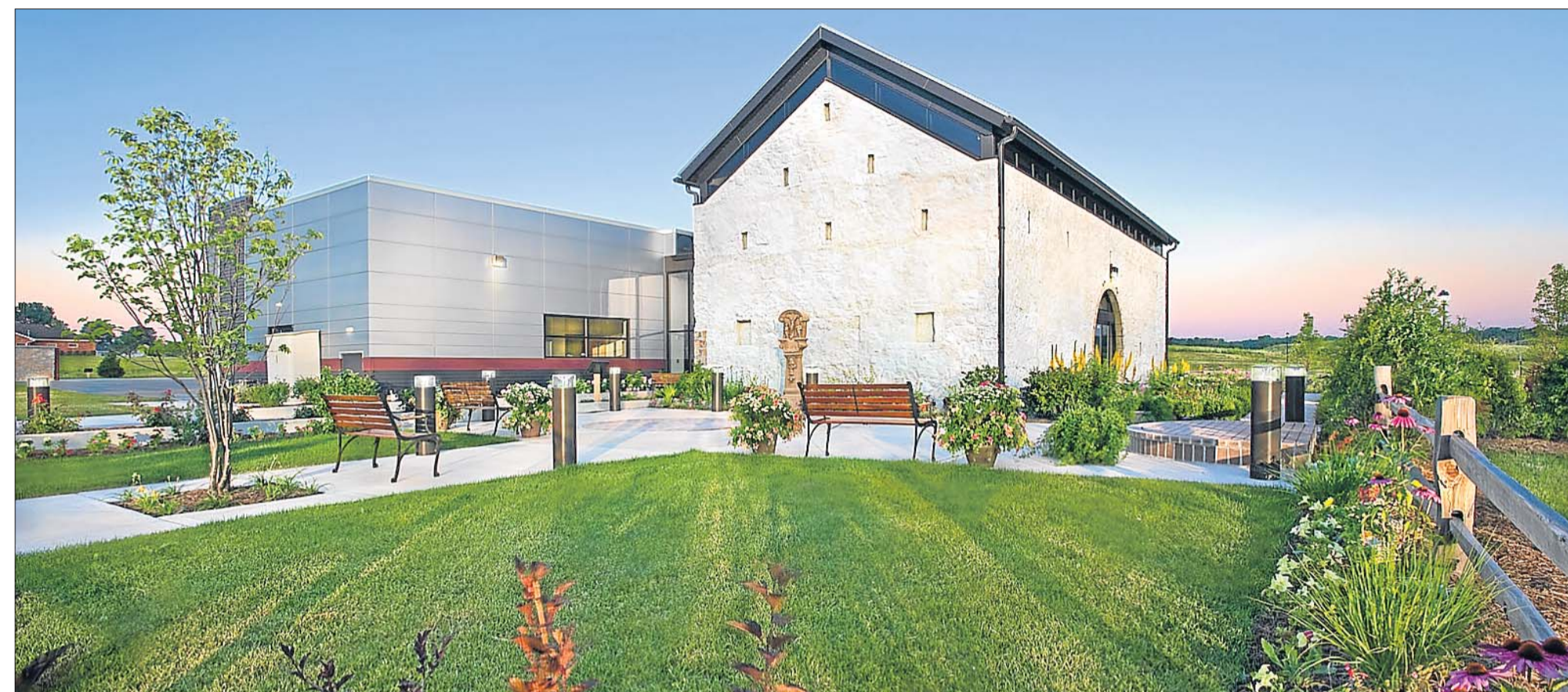
Das „Luxembourg American Cultural Center“ wird heute feierlich eröffnet.