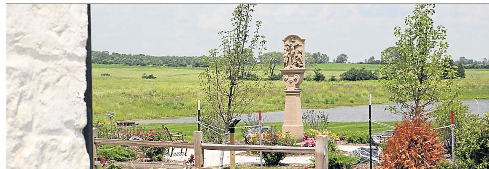
Ein schmucker Garten im luxemburgischen Stil lädt die interessierten Besucher aus dem In- und Ausland zum Verweilen ein.