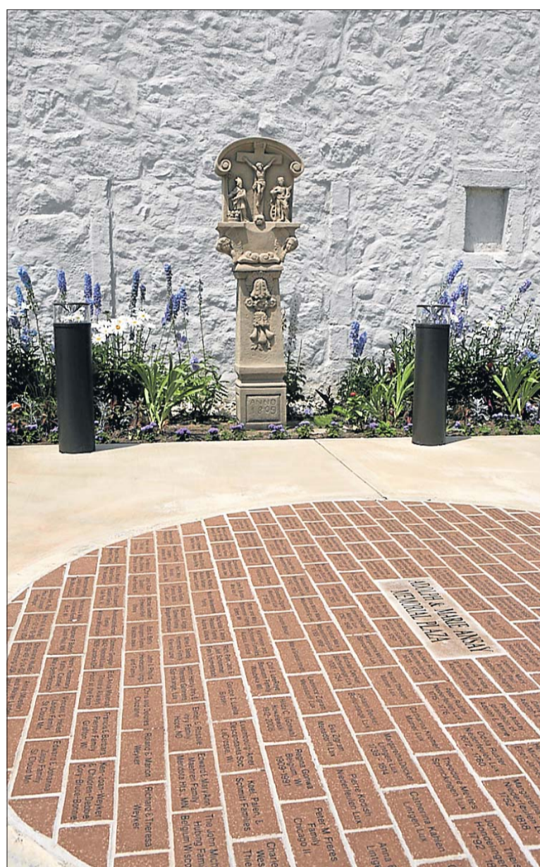
Auf dem Bodenmosaik wurden die Namen der edlen Spender des Kulturzentrums verewigt.