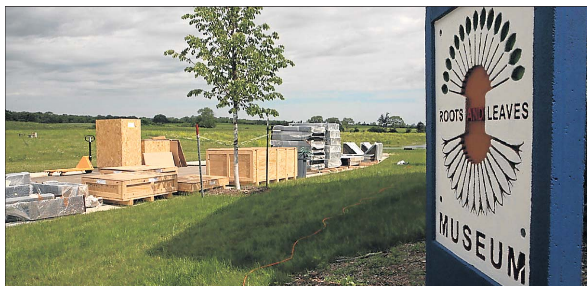
Das „Roots and Leaves Museum“ wurde vor drei Wochen mit Hilfe von beiden Seiten des Atlantiks fertig eingerichtet.