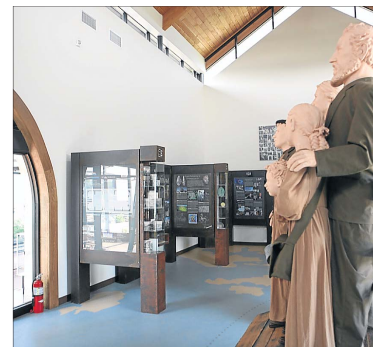
Ein großer Teil der Ausstellung widmet sich dem Leben der luxemburgischen Pioniere in den USA.