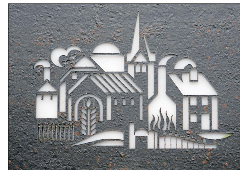
Die Themenhinweise über den Exponaten wurden mit Hochdruckwasser aus dem Luxemburger Stahl gestanzt.