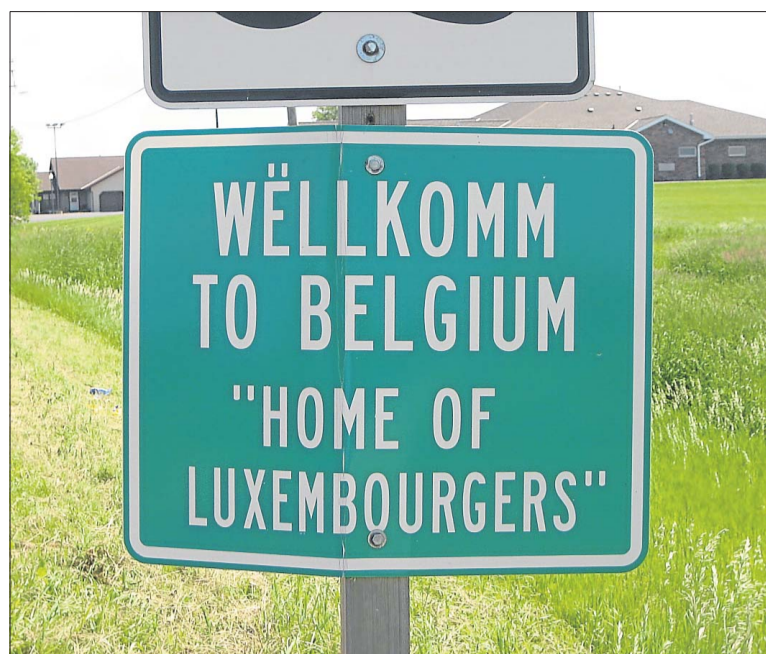
Das 1 000-Seelen-Dorf Belgium wurde nach der Herkunft seines Ortsgründers benannt.

aber auch Sicherheit innerhalb des Kontinents verholfen habe. „Durch die kleine Ortschaft Schengen ist Luxemburg heute weltweit bekannt. Und jeder weiß, welche Bedeutung ein Schengen-Visa heute besitzt“, so die Ministerin, bevor sie die Geschichte der Ein- und Auswanderung in Luxemburg, aber auch die starke Bindung zwischen Luxemburg und den USA vor hunderten Zuhörern näher beleuchtete. „Eines aber ist klar: Das heutige Einwandererland Luxemburg verdankt dem traditionellen Einwandererland USA unglaublich viel. Und aus diesem Grund wünsche ich unseren Freunden der ‚Luxembourg American Cultural Society‘ und der ‚Roots and Leaves Association‘ alles Gute bei ihrem Ziel, die Geschichte der Luxemburger Pioniere in den USA weiterhin zu bewahren.“ Mehr zu der feierlichen Eröffnung und dem „Heritage Weekend“ im US-Bundesstaat Wisconsin lesen Sie in unserer Ausgabe vom kommenden Montag.