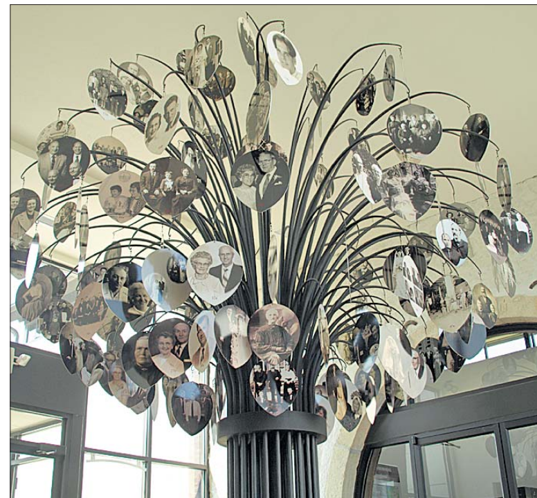
Der Family Tree: Die Wurzeln (Roots) stehen für die luxemburgischen Pioniere und ihr Erbe, während die Blätter (Leaves) die Entfaltung dieses Erbes und die Nachfahren der Auswanderer symbolisieren. Der Family Tree steht im „Krier Wellkomm-Center“, dem Verbindungsstück zwischen Museum und Forschungszentrum.